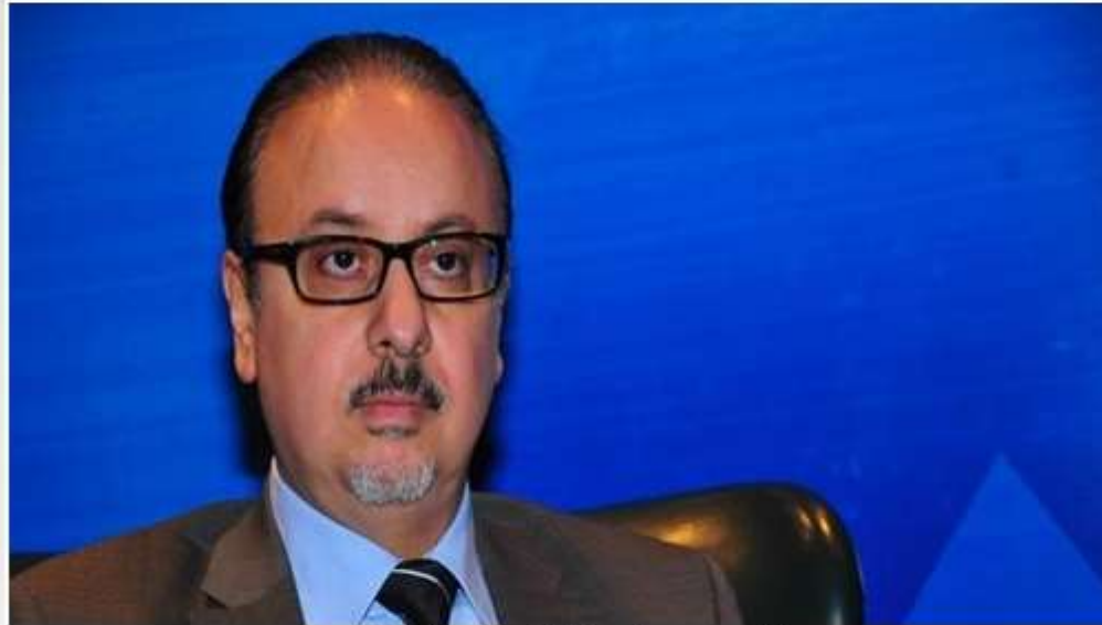
المهندس ياسر القاضي وزير الاتصالات